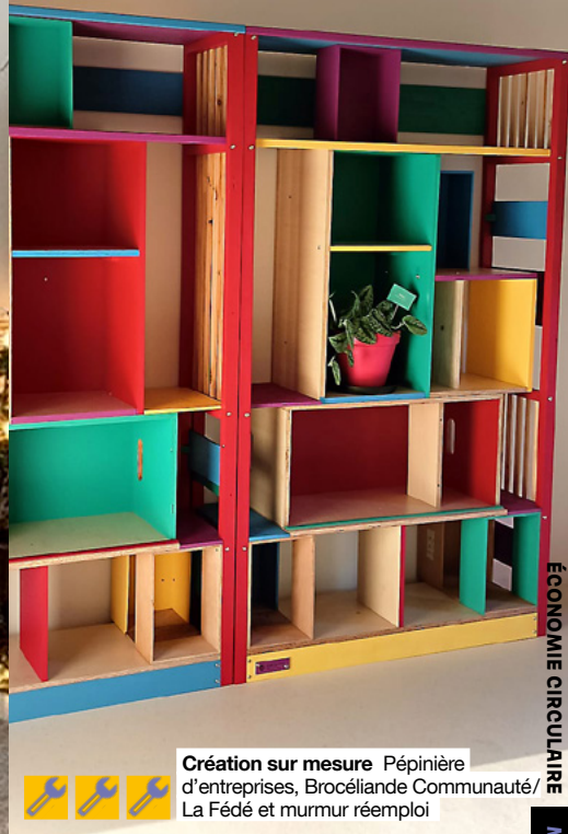
Création sur mesure Pépinière d'entreprises, Brocéliande Communauté / La Fédé et murmur réemploi