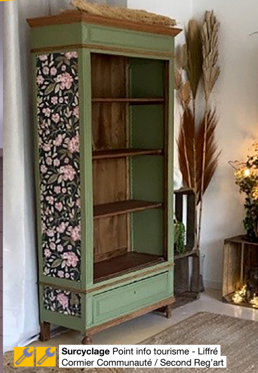
Surcyclage Point info tourisme - Liffré Cormier Communauté / Second Reg'art