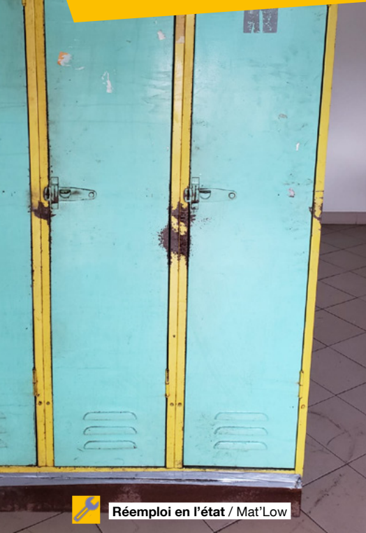
Réemploi en l'état / Mat'Low