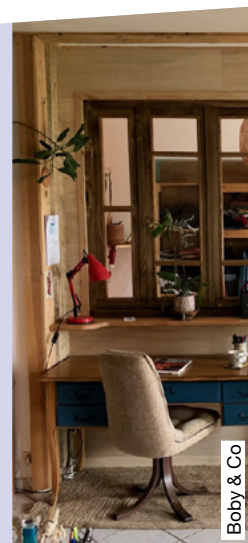
Boby & Co